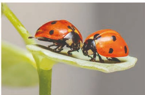
zhuān zhuā hài chóng dāng diǎn xīn 专抓害虫当点心