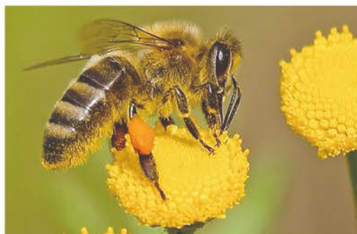
gěi dà jiā sòng mì táng chī 给大家送蜜糖吃