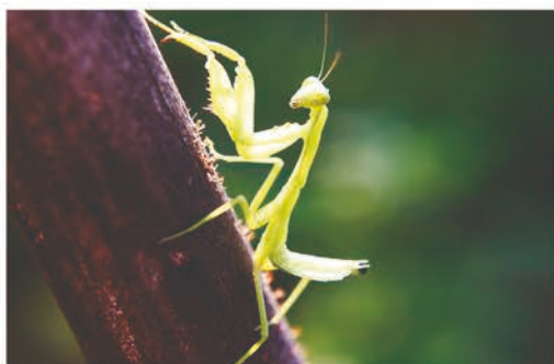
tiào lái tiào qù zhuō huáng chóng 跳来跳去捉蝗虫