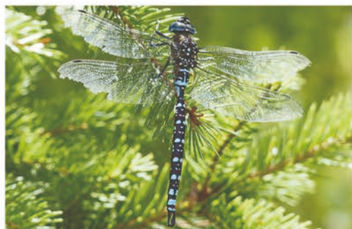
fēi lái fēi qù chī wén chóng 飞来飞去吃蚊虫